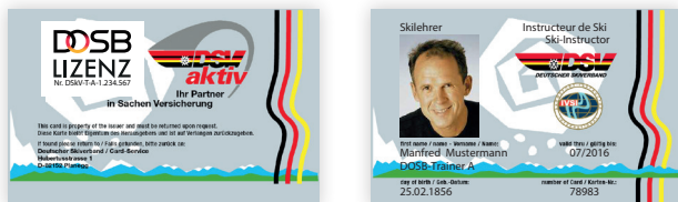
Individuell: Einbindung des DOSB-Lizenz Signs in verbandseigene Formate (hier: Scheckkarte)