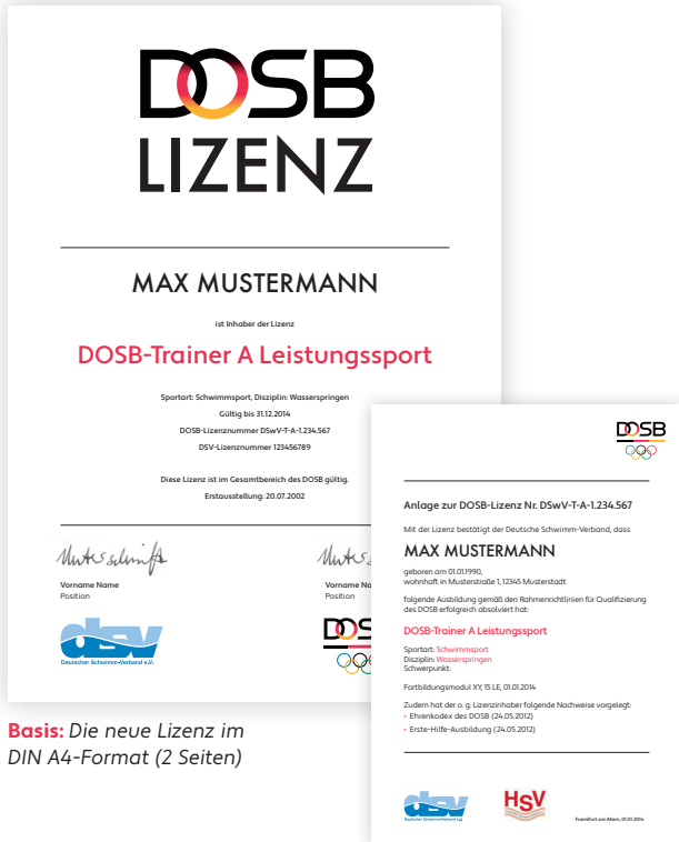
Basis: Die neue Lizenz im DIN A4-Format (2 Seiten)